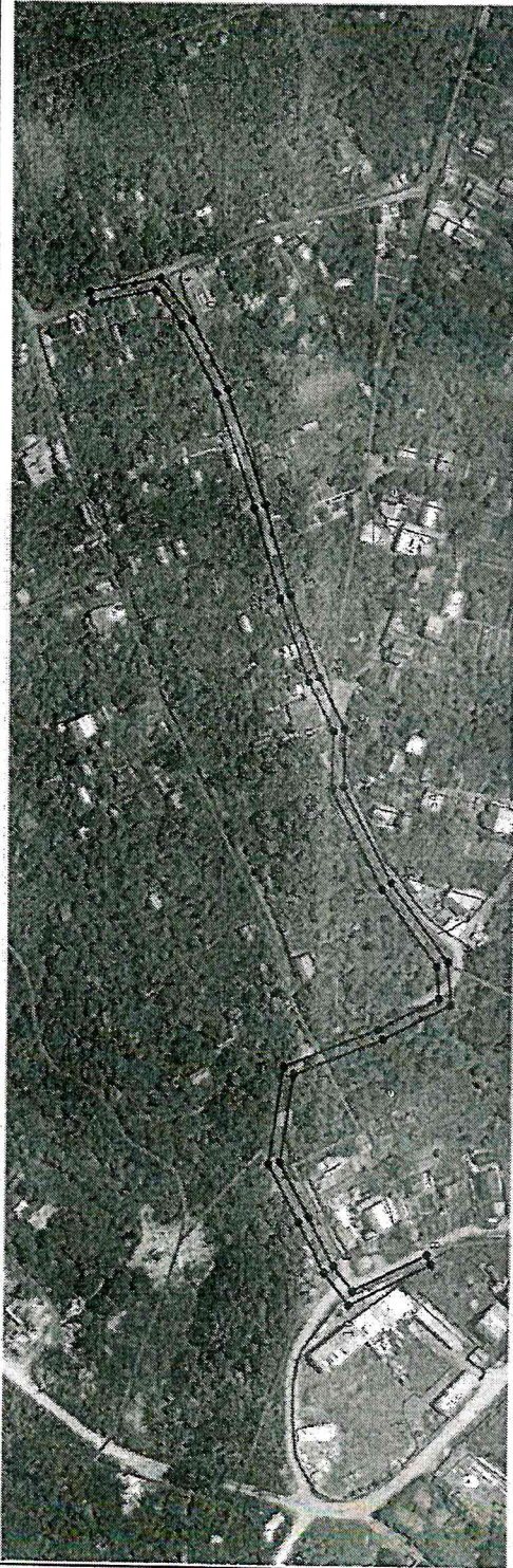
Раздел 4 План границ объекта